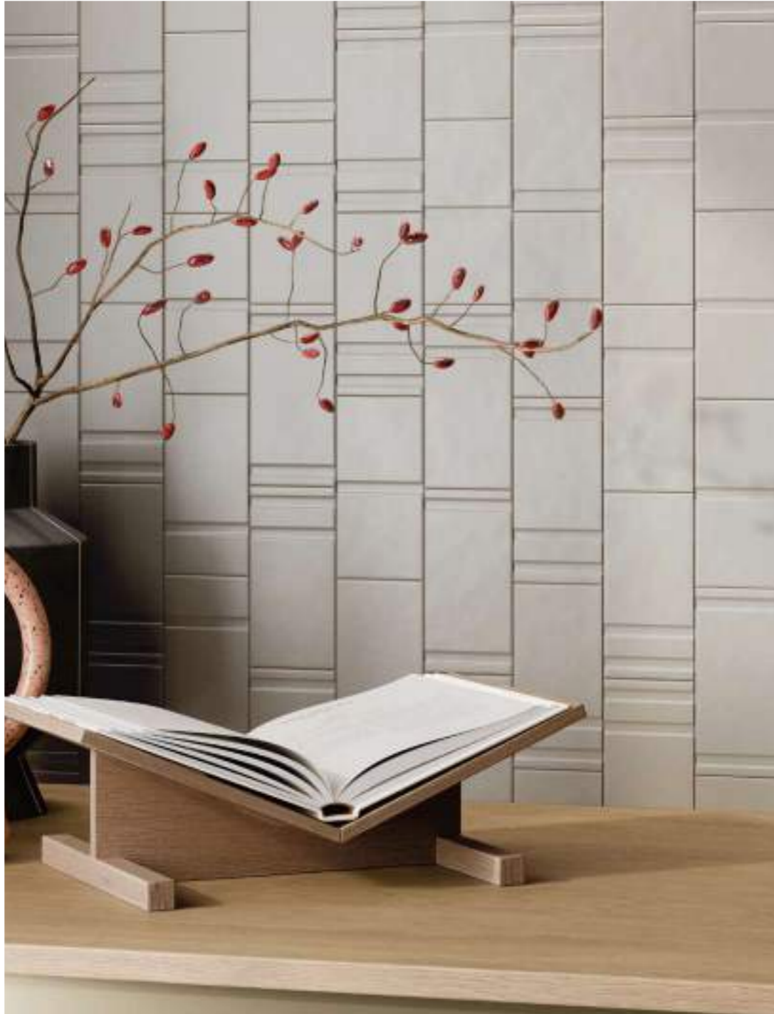
GREY DECOR MIX 7,5x15_3"x6" Matte