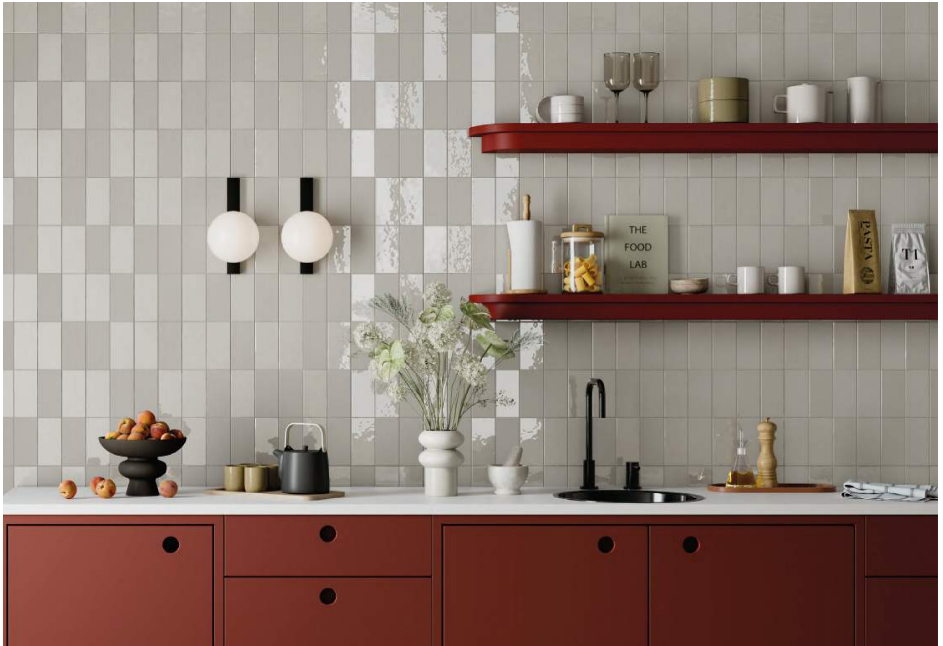
GREY 7,5x15_3"x6" Matte - Glossy