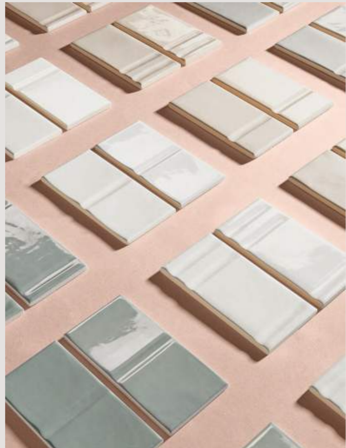
Grooves - all colors and finishes

6 Elemente (1 glatte Oberfläche und eine Mischung aus 5 dekorativen Strukturen) und 4 Farbvariationen - White, Bone, Grey und Sage - die von glänzend bis supermatt reichen.