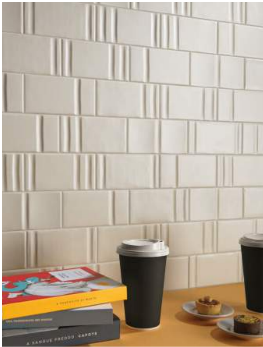
BONE DECOR MIX 7,5x15_3"x6" Matte