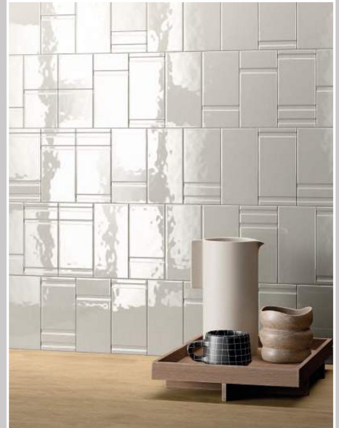
GREY & GREY DECOR MIX 7,5x15_3"x6" Glossy