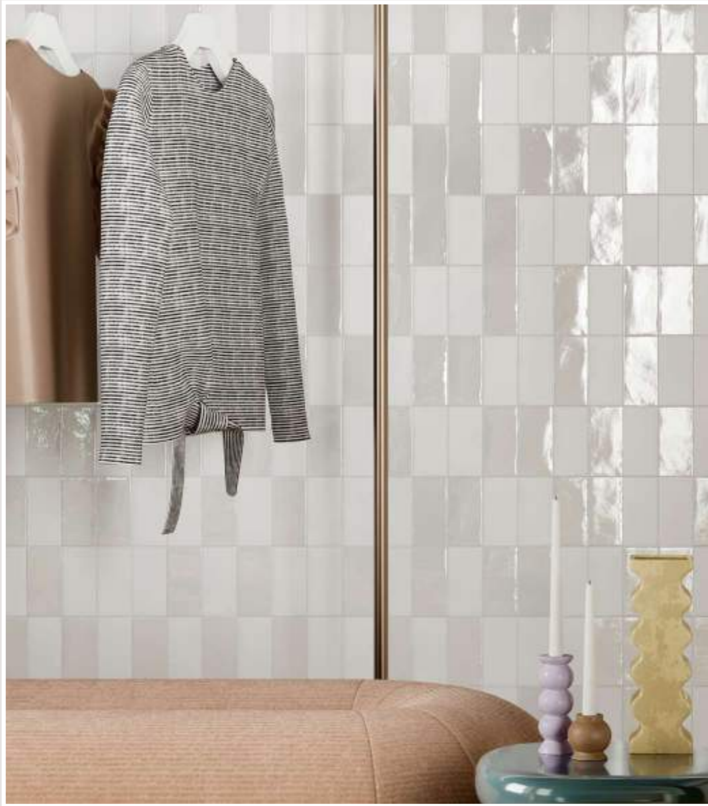
WHITE 7,5x15_3"x6" Matte - Glossy

Raffinati giochi di rifrazione della luce.