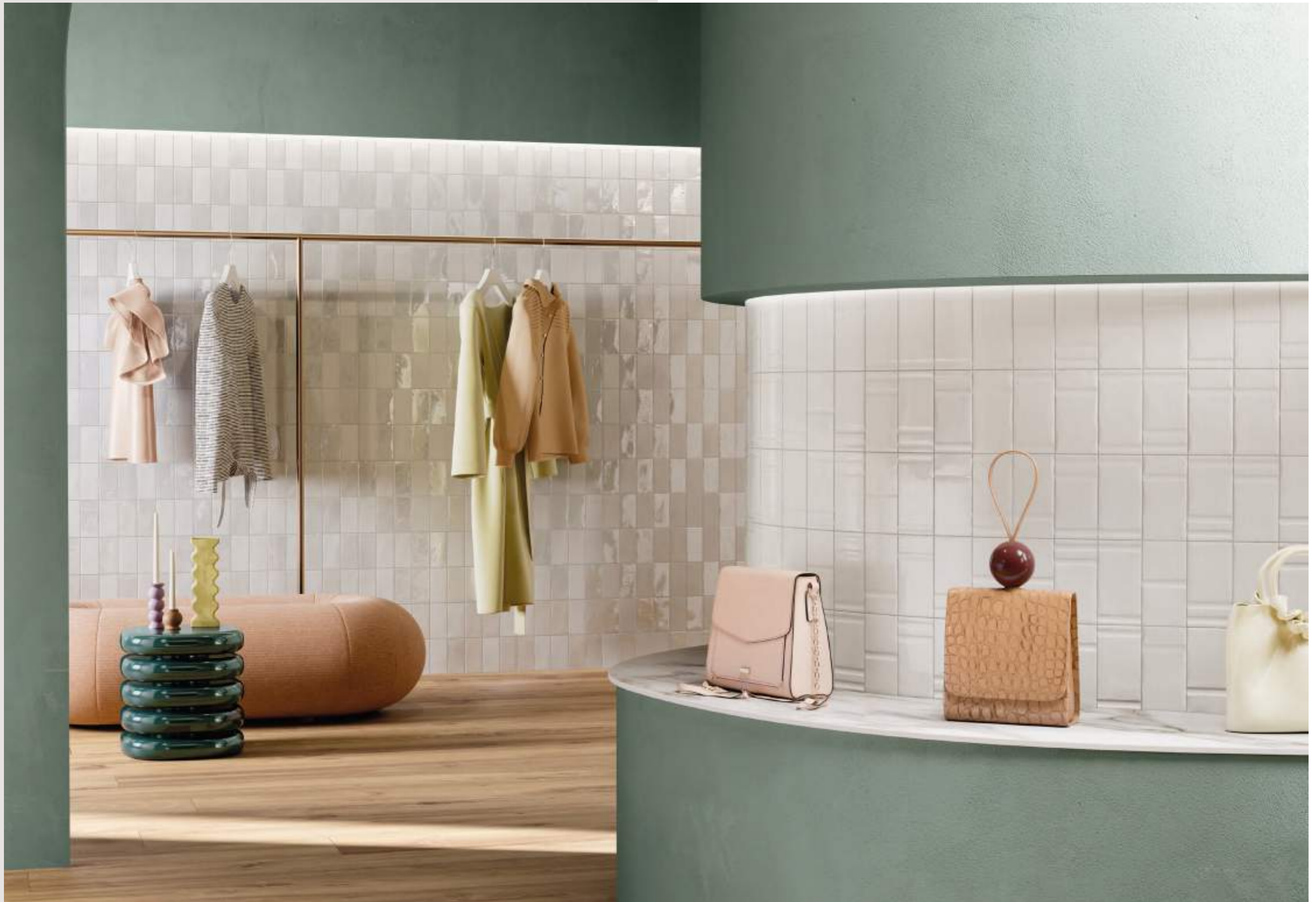
WHITE 7,5x15_3"x6" Matte - Glossy - WHITE DECOR MIX 7,5x15_3"x6" Glossy