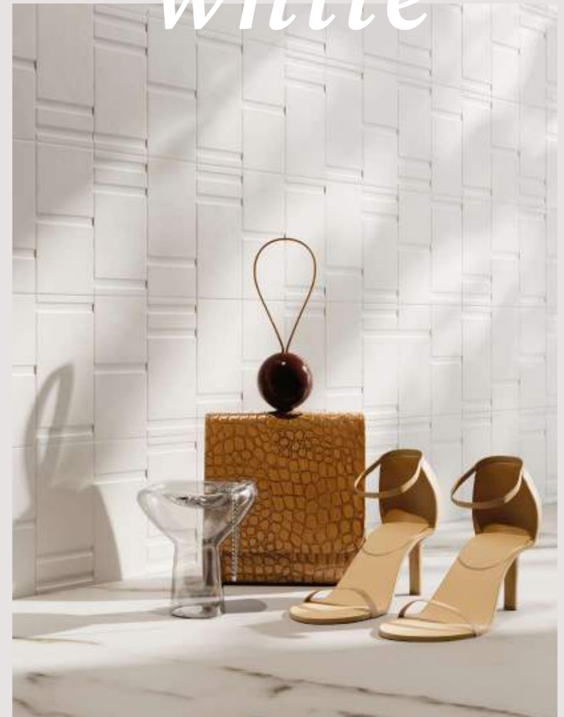
WHITE DECOR MIX 7,5x15_3"x6" Matte - CALACATTA Nat