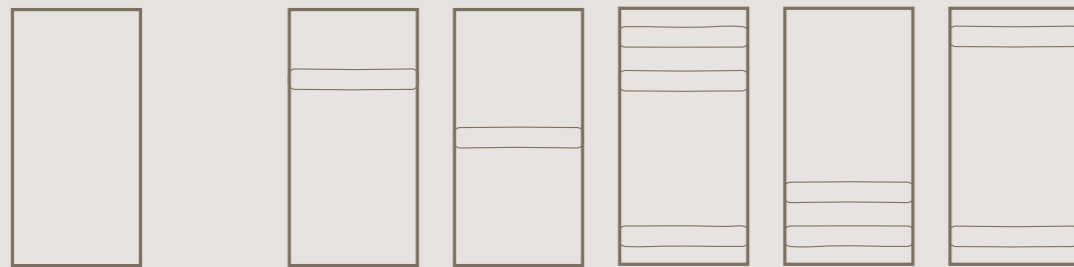
7,5x15_3"x6" Matte | Glossy

4 le colorazioni e 2 le finiture, matte e glossy, una dualità pensata per disegnare spazi architettonici unici, attraverso una dinamica e sofisticata alternanza di ombre e riflessi che anima le pareti.